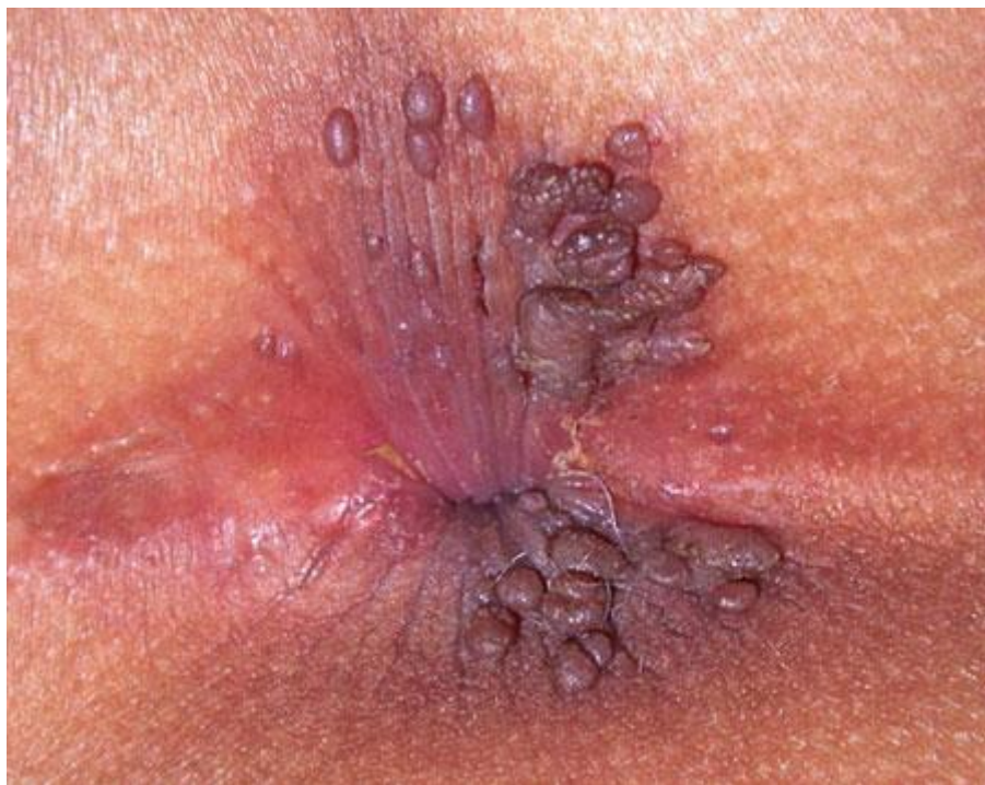
Hình ảnh sùi mào gà hậu môn

khi mắc bệnh, triệu chứng sùi mào gà ở hậu môn cũng bao gồm những nốt sùi mọc tại cả bên trong, ngoài cũng như xung quanh vị trí ở vùng hậu môn.