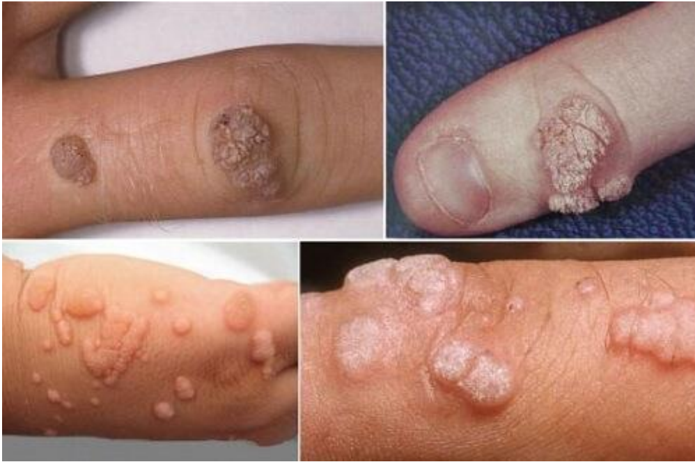
- Hình ảnh sùi mào gà tại chân tay

Đặc trưng của chúng đều là một số nốt u nhú sần sùi, tập trung thành từng cụm. Những bạn phải chú ý nếu gặp cần các triệu chứng này để đến khám sớm, mau chóng.