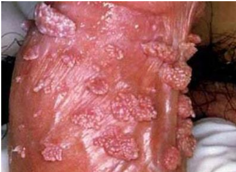
Hình ảnh sùi mào gà tại phái mạnh