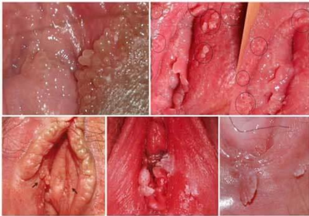
Hình ảnh sùi mào gà ở nữ